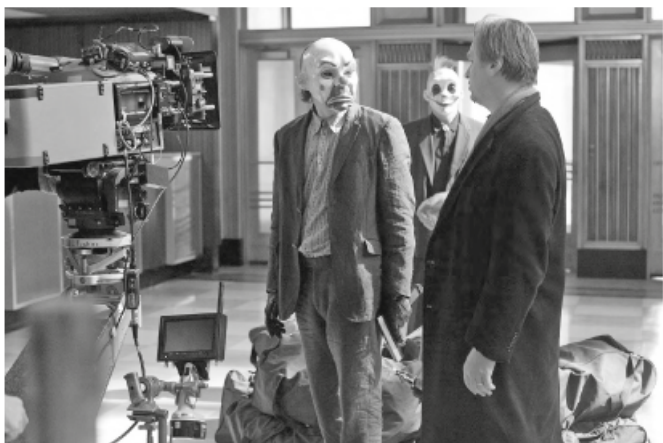
Christopher Nolan en el rodaje de El Caballero Oscuro .

se ha integrado en el sistema y ha claudicado? Pudiera ser así o bien pudiera ser que en el intento de responder a sus propias preguntas haya dado un viraje desde posiciones puramente interrogativas hacia posiciones afirmativas, desde un «No hay salida» hasta un «Debemos encontrar una». Es un viraje lícito y está bien argumentado y, como dije a propósito de Visconti y Fellini, la fidelidad al propio ideario no ha de suponer ensimismamiento o inmovilismo.