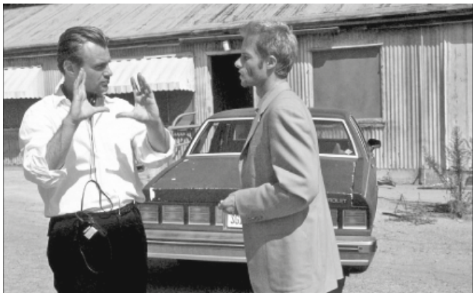
Memento , foto de rodaje.

ciones de gran presupuesto sucedería de manera cuasi natural, sin grandes componendas ni graves fricciones, como sí ocurrió con, pongamos por caso, Darren Aronofsky (pero esta es otra historia). En apenas unos años, Nolan abandonó los presupuestos de unos pocos millones a favor de proyectos que rebasaban la vertiginosa cifra de los cien millones de dólares. El paso dado fue enorme, aunque él se haya empeñado en minimizarlo: