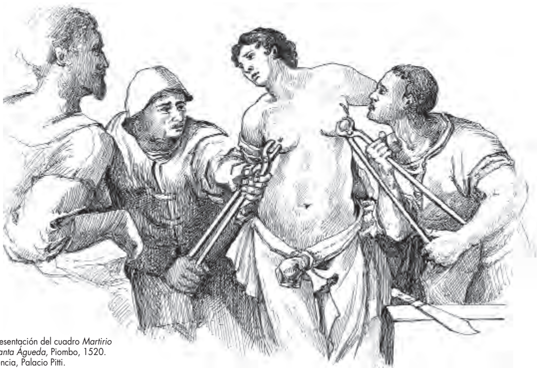
Representación del cuadro Martirio de santa Águeda , Piombo, 1520. Florencia, Palacio Pitti.